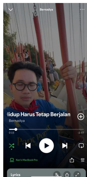
(Gambar 3 Tangkapan Layar video latar lagu di platform spotify)

Lagu dengan judul "Untungnya, Hidup Harus Tetap Berjalan" viral karena dianggap sebagai penguat untuk seseorang ditengah keadaan hidup yang tidak menentu. Banyak pula yang membuat video di media sosial tentang kepahitan hidup diiringi dengan lagu dari Bernadya tersebut. Bahkan ada video dari akun media sosial seseorang yang dipakai oleh musisi tersebut untuk cover lagu di halaman streaming musik.